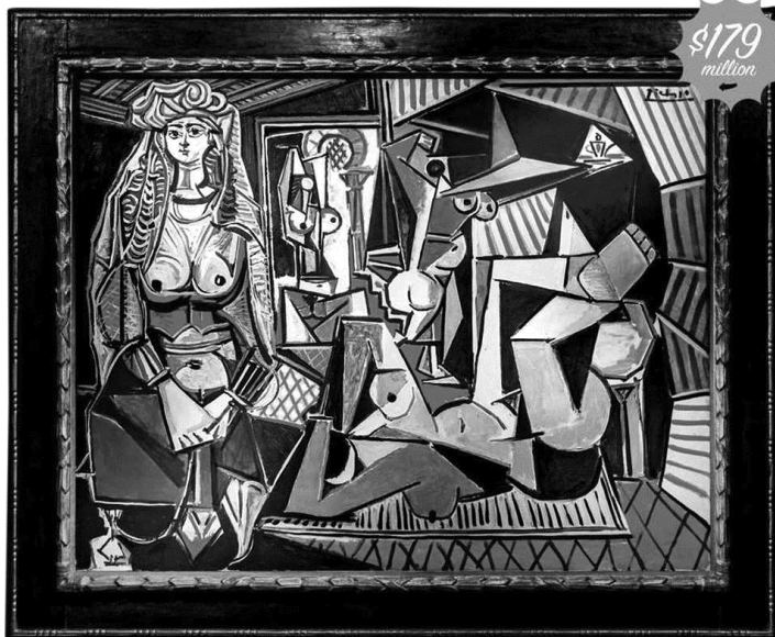
Les Femmes d'Alger (Picasso)

(1) Le 11 mai, Christie's a vendu Les Femmes d'Alger , une toile de Picasso, pour 179,4 millions de dollars, un prix record pour une vente publique. Jusqu'à présent, c'était Francis Bacon qui détenait le record de l'œuvre la plus chère vendue aux enchères avec son triptyque représentant Lucian Freud, vendu pour 142,4 millions de dollars en 2013. Les toiles atteignent des prix encore plus élevés en dehors des salles de ventes. Deux Tahitiennes , de Paul Gauguin, a atteint près de 300 millions de dollars lors d'une transaction privée en début d'année, selon The New York Times . Du jamais-vu pour une œuvre d'art. (2) Ces montants énormes suscitent de nombreuses interrogations, d'autant plus qu'en ce moment les investisseurs du monde entier s'inquiètent de la hausse des actions,